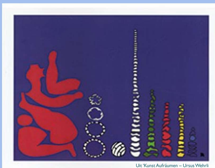
Uit 'Kunst Aufräumen – Ursus Wehrli