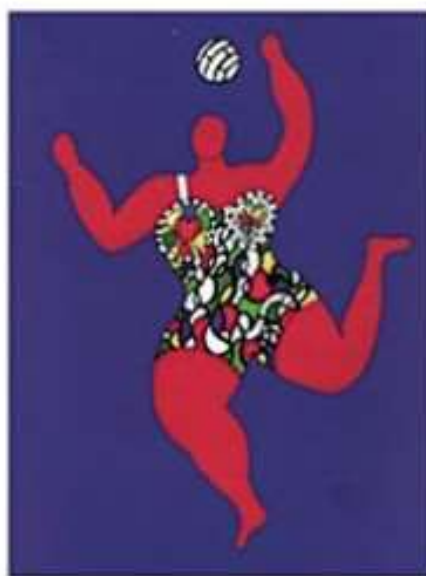
Uit 'Kunst Aufräumen – Ursus Wehrli